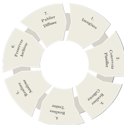
Fig. 1 – Cartographie des actions des réseaux métiers autour de la gestion des données.

Gérer les données de la recherche est un processus complexe qui suppose un travail long et coûteux, des moyens techniques et humains parfois importants et qui comprend plusieurs étapes avant d'aboutir à la publication et l'archivage de données fiables, de qualité, respectueuses du droit des personnes et de la législation en vigueur.