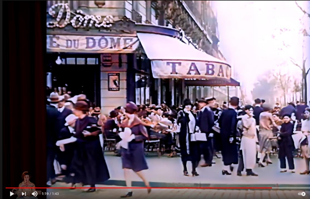
A Day in 1920's Paris | 1927 AI Enhanced Film [ 60 fps, 4k]